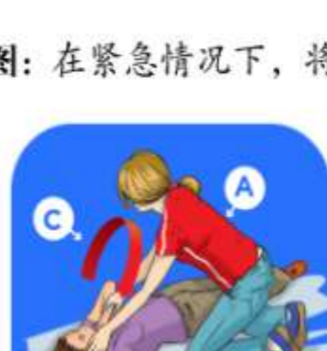
图：在紧急情况下，将一名躺在自己身后的人置于恢复位置 3