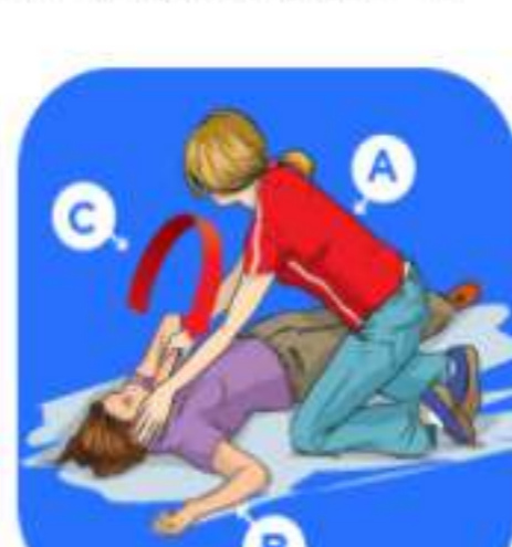
图：在紧急情况下将一名平躺的人置于复苏体位