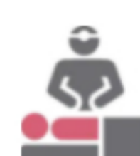
复杂/失败的脊柱/背部手术